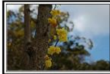
蠟梅開花は1月下旬頃