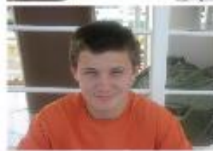
とても シャイなシェイク