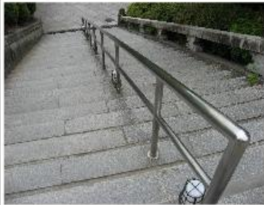
最終日のお別れ会