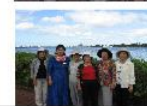
パールハーバー でガイドさんと