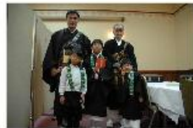
当然その他私達寺族も出勤させて頂きます。心よりお待ちしております。

本年も標記のとおり、親鸞聖人のご命日（1月16日）をご縁にお勤めする報恩講法要を厳修致します。 ここ数年日曜日に合わせて法要日を変えて参りましたが、本年より曜日に関わらず、元の12月18日、ご本尊さまを長善寺にお迎えした日に戻したいと思えます。 また、本年は修復中の為、対面所にてお勤め致します。寒い場所ですが、来年からは新しくなった本堂にて行いますので、どうぞご容赦願います。 みなさまお誘い合わせの上、暖かい服装でお越しくださいませ。 住職