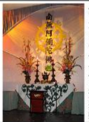
ハワイアンキルトで作られた打敷