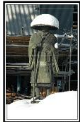
去年の報恩講は大雪でしたね