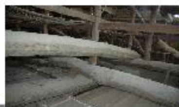
130年ぶりに日を浴びた本堂天井裏