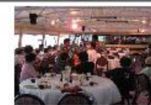
船での楽しい夕食