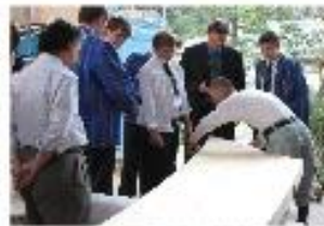
修復現場 熱心に見学