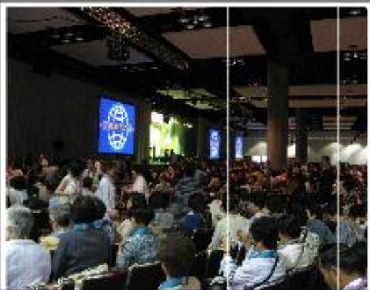
会場ホノルルコンベンションセンター 心に残るすばらしい大会でした