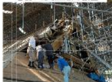
樹齢約1000年の木を使った破風板の設置

11間4面の本堂に加え 通常より廊下等が広い そのため分更に大きな屋根 いよいよ葺き始め！ 来春きれいな姿を・・・。